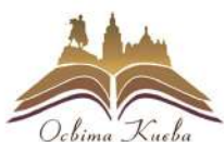
ДЕПАРТАМЕНТ ОСВІТИ КМДА DEPARTMENT OF EDUCATION OF KCSA